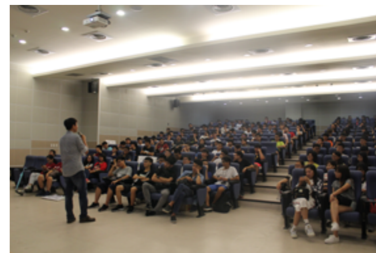
與大一入學新生分享在校經歷對職涯發展的影響