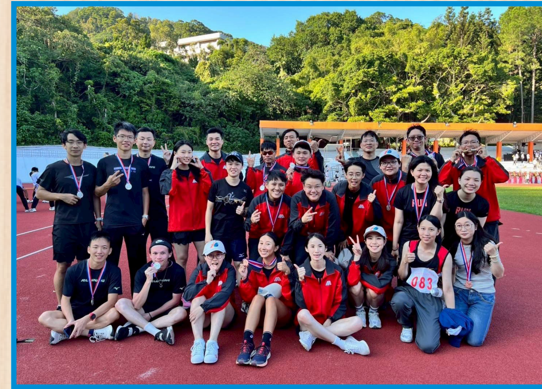
女子田徑錦標 季軍 男子田徑錦標 殿軍