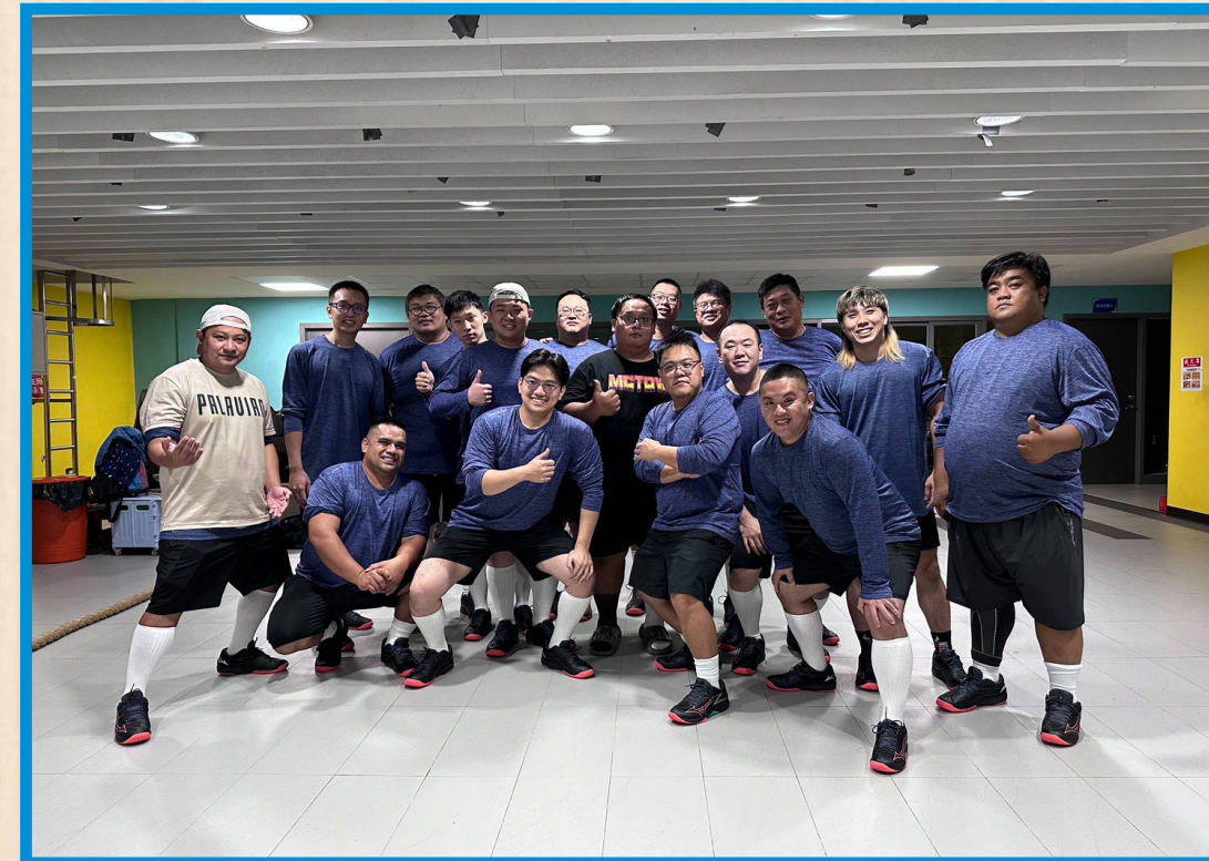
男子拔河錦標 殿軍