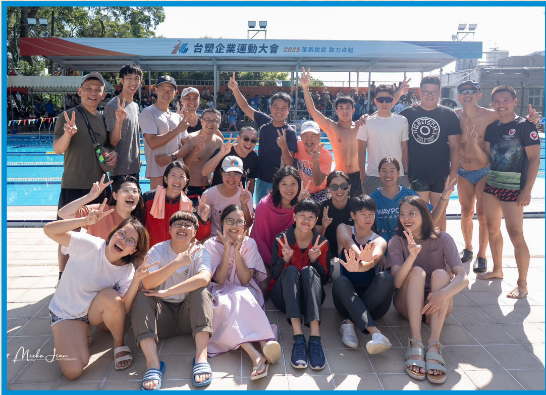
男子游泳錦標 冠軍 女子游泳錦標 冠軍