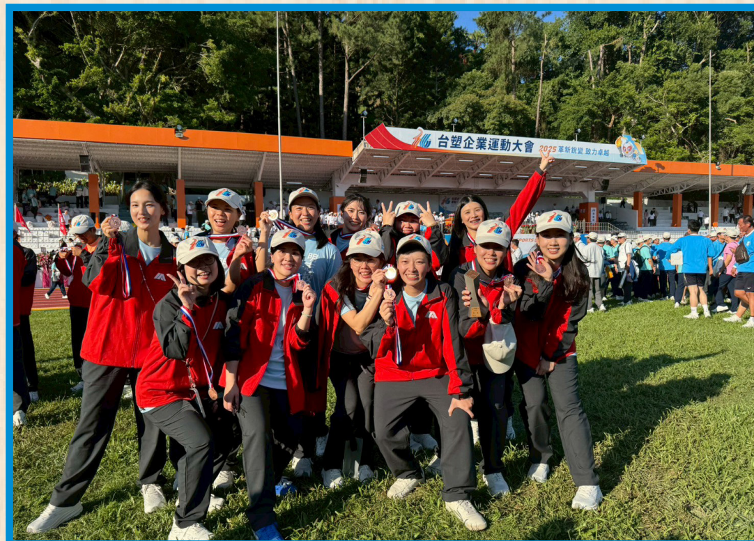
女子排球錦標 季軍